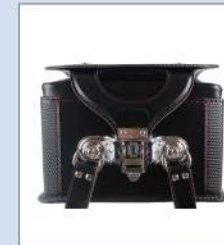
ワンタッチロック錠前