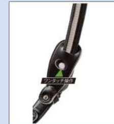
ラチェットアジャスター